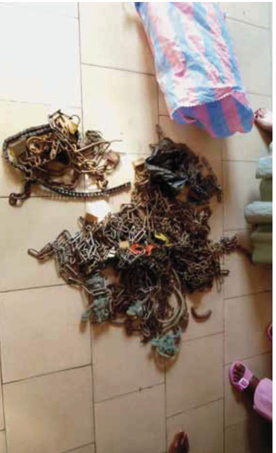
Ungezählte gebrauchte Ketten auf den Boden geworfen

Auf unseren Exkursionen sollten wir allerdings noch andere Institutionen kennenlernen, die sich die Entlassvorbereitung und die Nachbetreuung der Patienten, ambulante Versorgung in sogenannten Relais, landwirtschaftliche Rehabilitation vorgenommen hatten. Und überall, wo wir waren, war eine intensive Debatte im Gang, wie die Versorgung der Kranken verbessert werden könnte. Dabei haben wir sozialpsychiatrische Konzepte und den Leitsatz »ambulant vor stationär« vertreten.