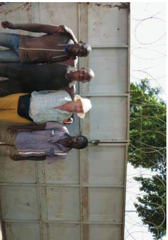
Der Autor zusammen mit drei Patienten der Männerpsychiatrie in Bouaké